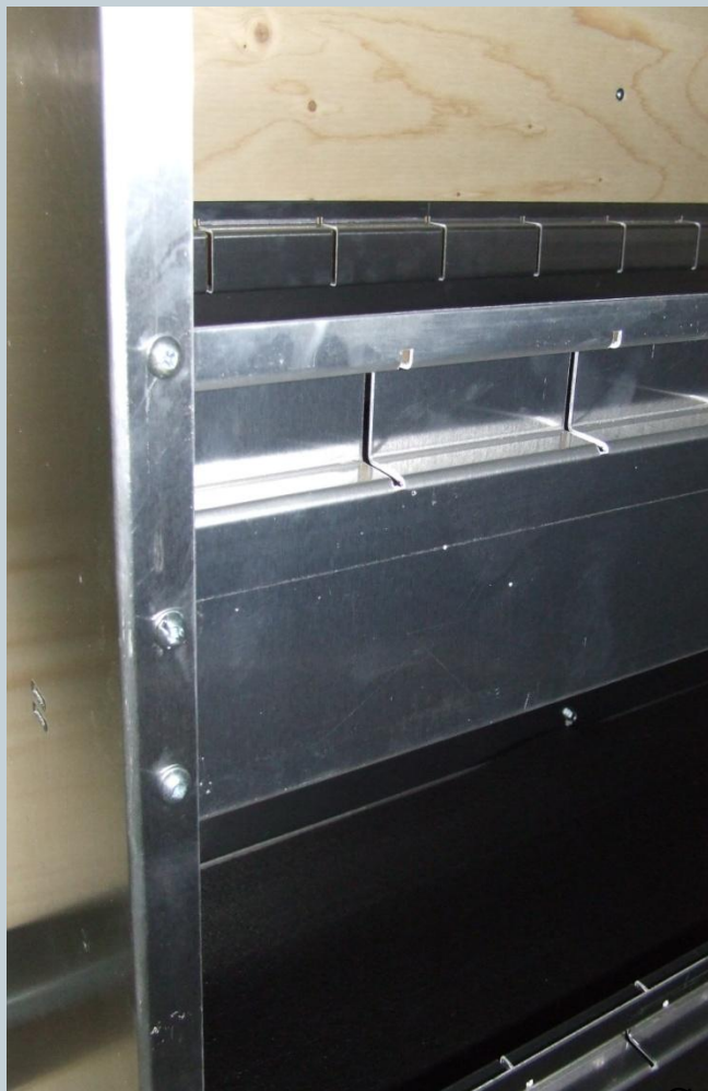
Rebord de tablettes 6" de haut