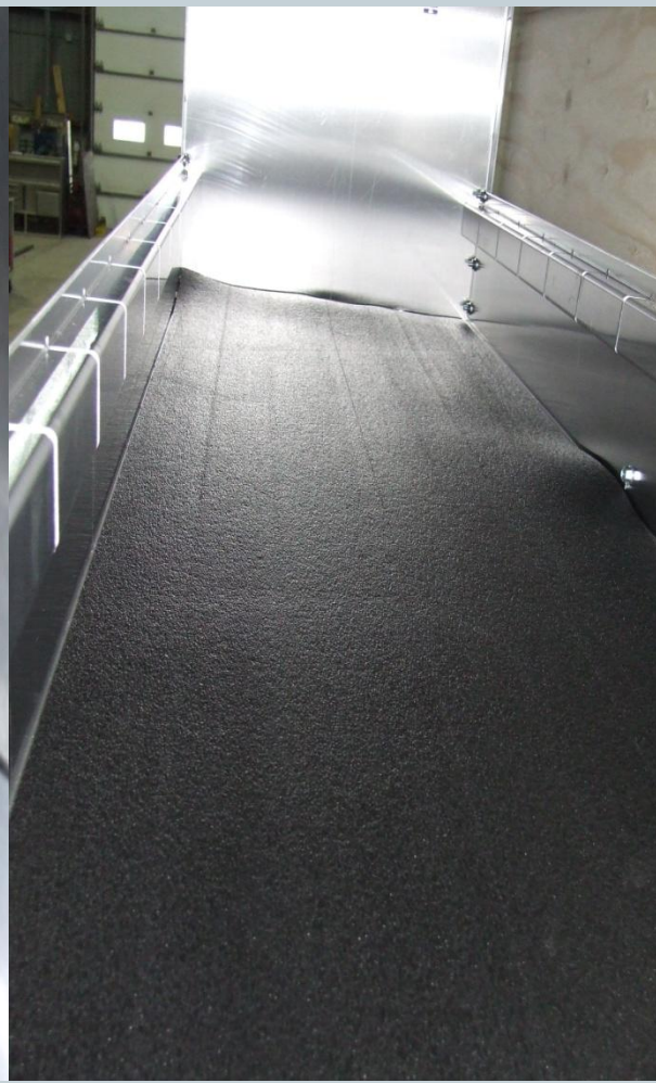
Caoutchouc dans les fonds de tablettes