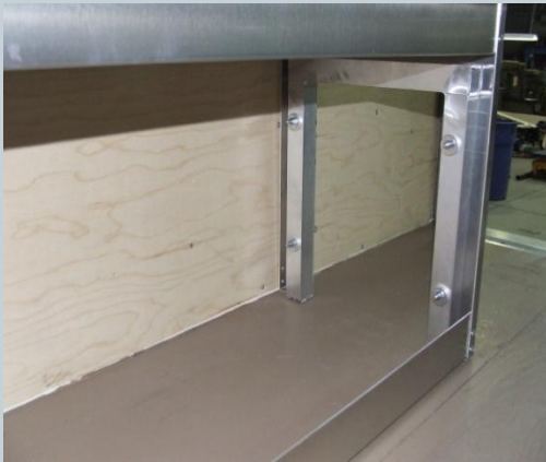
Rangement des tubes