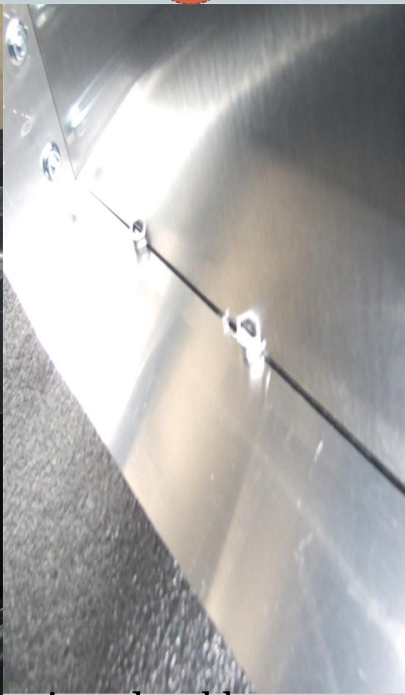
Soutiens de tablettes au extrémité